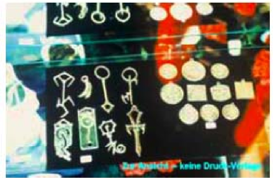
Abb. 3: Vampirische Abzeichen aus Manhattan: Sigils und Schlüssel des Sanguinariums; hier ausliegend bei Halloween Adventures (East Village, Manhattan). Obere Reihe von links: Schlüssel zur Hölle - unbekannt (Eck-Zähne?) - Schlüssel zum Himmel - Schlüssel zur Unterwelt; untere Reihe von links: Amulett der Hölle - Amulett des Himmels - Schlüssel nach Arcadia - Sanguine Ankh (= Bladed Ankh: Kombination aus Klinge und Ankh).